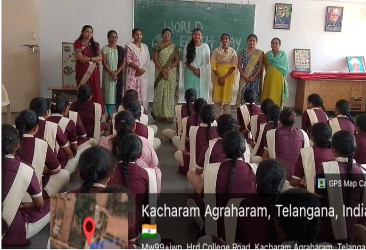
Kacharam Agraharam, Telangana, India