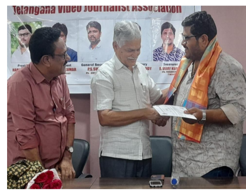
మాట్లాడుతూ మీడియా అక్రిడేషన్ కమిటీలో 23 వ తారీకు