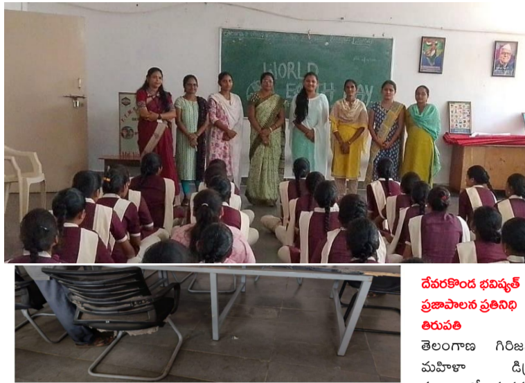
దేవరకొండ భవిష్యత్ ప్రజాపాలన ప్రతినిధి తిరుపతి

- కొండమల్లేపల్లిలో ఎక్స్‌జిజీ సిబ్బంది రూల్ వాచ్‌లో 8 లీటర్ల నాటు సారాను స్వాధీనం చేసుకున్నారు.