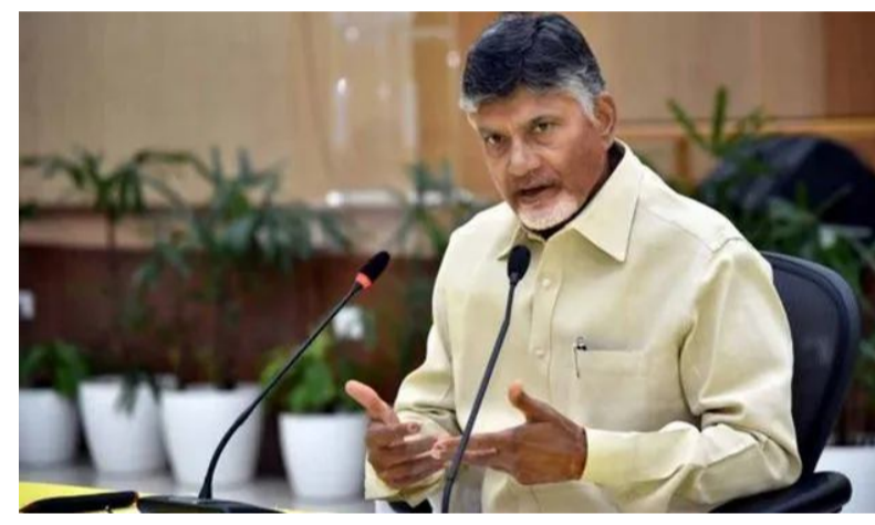
చంద్రబాబు నాయుడు ఆయన గుర్తు చేశారు. మహిళ రిజర్వేషన్ బిల్లును మొదటి నుంచి కాంగ్రెస్ పార్టీ వ్యతిరేకిస్తుందని వివరించారు. 2023లో మహిళా రిజర్వేషన్ బిల్లుపై మోదీ ప్రభుత్వం చట్టం చేసిందన్నారు. రాష్ట్రవ్యాప్తంగా ఈ కార్యక్రమాలు నిర్వహించేందుకు ఒక

అమరావతి, ఏప్రిల్ 24: చట్టసభలో మహిళ రిజర్వేషన్ బిల్లుపై ఇండియా కూటమి వైఖరిని ప్రజలకు ముఖ్యంగా మహిళలకు వివరించాలని ఎన్డీయే కూటమిలోని పార్టీల నేతలకు సీఎం చంద్రబాబు నాయుడు స్పష్టం చేశారు. శుక్రవారం అమరావతిలో ఎన్డీయే నేతలు, ఆయా పార్టీలకు చెందిన ఎమ్మెల్యేలు, ఎమ్మెల్యేలతో ఆయన టెలి కాన్ఫరెన్స్ నిర్వహించారు. అందులో ఏపీ బీజేపీ చీఫ్ పీవీఎస్ మాధవ్ పాల్గొన్నారు. మహిళ రిజర్వేషన్ బిల్లును వ్యతిరేకించిన కాంగ్రెస్ పార్టీతోపాటు ఇతర భాగస్వామ్య పక్షాల వైఖరిని ప్రజలకు వివరించాలని సీఎం చంద్రబాబును పీవీఎస్ మాధవ్ కోరారు. అందుకు సీఎం చంద్రబాబు సానుకూలంగా స్పందించారు. రాబోయే 10 రోజుల్లో ఏపీ అసెంబ్లీ సమావేశాలు నిర్వహిస్తామని సీఎం చంద్రబాబు ప్రకటించారు. ఈ సమావేశాల వేదికగా 'ఈ అంశం' పై చర్చిస్తామన్నారు. మహిళ రిజర్వేషన్ బిల్లుపై కాంగ్రెస్ మినహా అన్ని