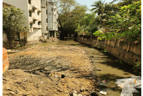
శ్రీనగర్ కాన్స్ ఎల్లారెడ్డిగూడలో పనులపై ప్రత్యేక పరిశీలన -- ముంపు సమస్యలకు చెక్ పెట్టే చర్యలు చేపడతం జూబ్బిహిల్స్ నియోజకవర్గంలో వర్షాకాలాన్ని దృష్టిలో ఉంచుకుని నాలా