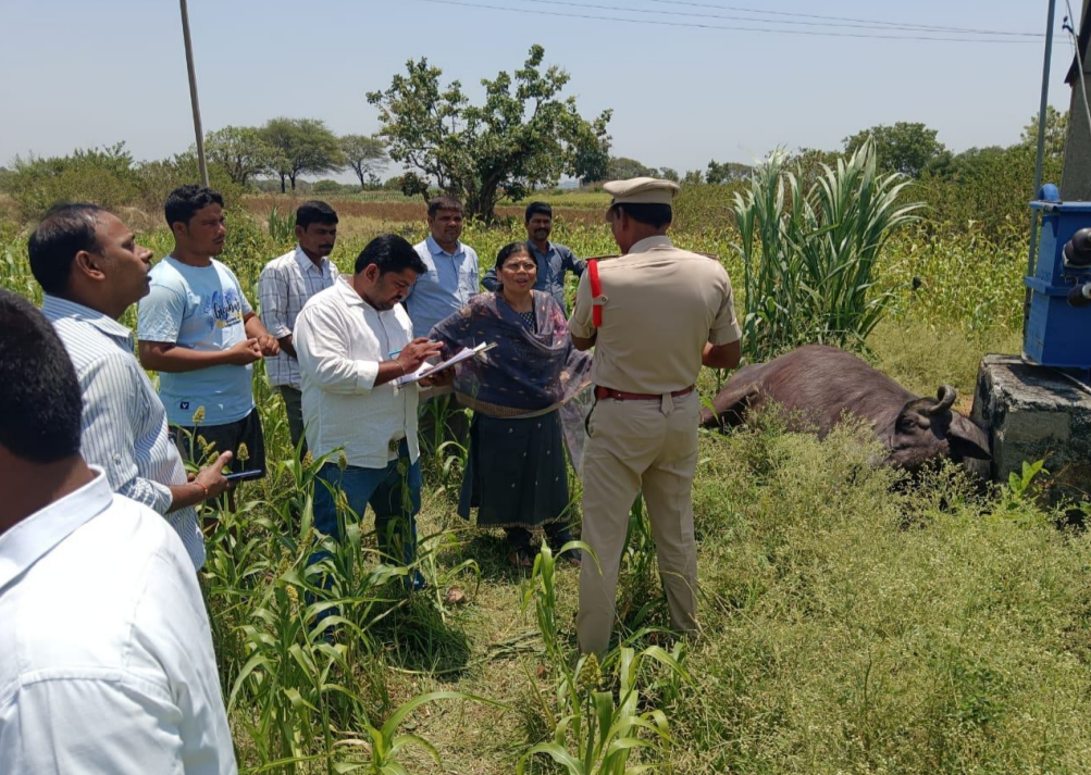
అందించాలని, భద్రతా చర్యలు కట్టుదిట్టం చేయాలని గ్రామస్థులు డిమాండ్ చేస్తున్నారు.